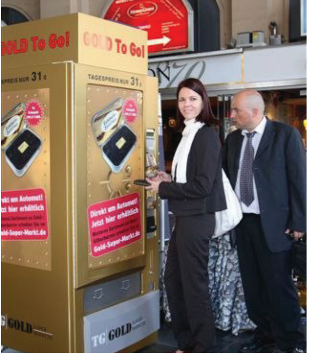
მასალა მოამზადა მანანა მიქელაძემ

ბერმანიში, ქალაქ ფრანკფურტის რკინიგ- ზის სადგურში, მსოფლიოში პირველი ოქროს გამე- იდველი აპარატი გაჩნდა. ნებისმიერ მსურველს აქ 1,5- დან 10 გრამამდე ოქროს შეძენა შეუძლია. აპარატი პლას- ტიკურ ბარათებსაც იღებს და ფულსაც, თანაც საბაზრო ფასების შესაბამისად, ფასებს თავადაც ავტომატურად ცვლის.